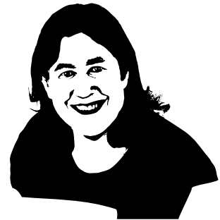
Chantal Hébert Québec

Productrice de télévision canadienne vouée à la défense des causes sociales, son parcours journalistique atypique l'a menée à créer le réseau VisionTV, la toute première chaîne multiconfessionnelle et multiculturelle au monde, faisant d'elle un modèle inspirant pour les jeunes leaders.