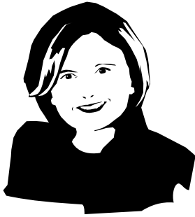
Maureen McTeer Ontario

Au cours de sa remarquable carrière qui embrasse le droit, la science et les politiques publiques, elle a défendu de nombreuses causes, dont la réforme des institutions démocratiques, la conciliation travail-famille et l'accès à la reproduction assistée.